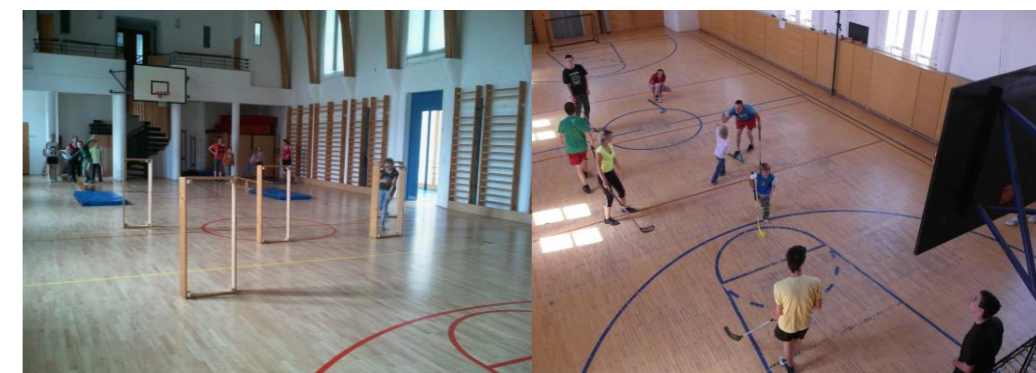
V tělocvičně pro nejmenší starší připraví například opičí dráhu, pro menší i větší florbal, přehazka.

„...Být součástí společenství... je velký dar, ne samozřejmost! Nikdo nemůže říci: Zachraňuji se sám. Všichni jsme ve vztahu, abychom se naučili být týmem. Bůh chtěl vstoupit do této dynamiky vztahů a přitahuje nás k sobě ve společenství, dává našemu životu plný smysl identity a sounáležitosti...“ papež František