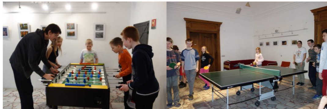
Na gymplu Kalčo, stolní tenis, deskovky.....