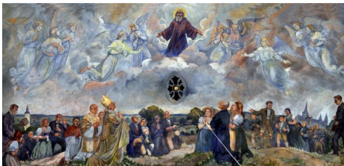
Nástrovní malba v chrámu sv. Gotharda v Modřicích, Rudolf Adámek 1930.

Poutní mši svatou, zahájenou ve 14:00 h bude celebrovat modřický rodák